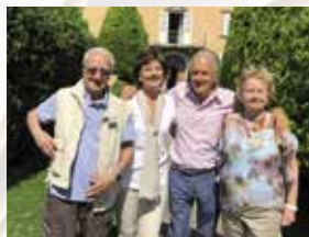
Il direttivo 2016

A seguito della recente adesione all'Associazione nazionale degli scrittori, la nostra Associazione ha la possibilità di essere ospitata prossimamente al Salone internazionale del libro.