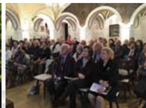
Settimana dello scrittore 1° edizione 2016